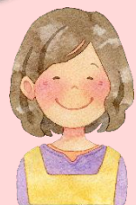
ボランティアさん

こども食堂が子どもたちの居場所であるように、和気あいあいと楽しく動けるボランティア活動は、私にとっても私の居場所となっています♡