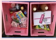
バルコブ 枚方公園店4.1