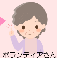
ボランティアさん

こども食堂が子どもたちの居場所であるように、和気あいあいと楽しく動けるボランティア活動は、私にとっても私の居場所となっています♡