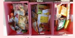
バルコブ ながお店4.29