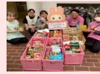
ytvフードドライブ (みんなの里子ども食堂) 422