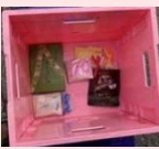
バルコブ 星ヶ丘店4.1