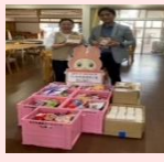
ytvフードドライブ (にしなり子ども食堂) 4.22