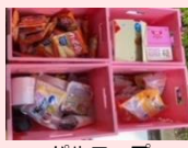
バルコブ 枚方公園店4.28