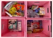
バルコブ つるみ店4.28