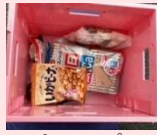
バルコブ 星ヶ丘店4.28