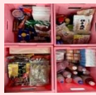
バルコブ つるみ店4.1