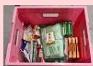
近畿労働金庫 天下茶屋支店 6.3