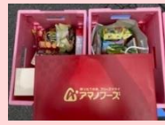
交野市環境事業課 6.26