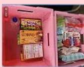
西部環境事業センター 6.27