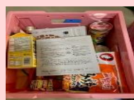
交野市 ゆうゆうセンター 6.11