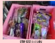
寝屋川市 産業振興センター 6.17