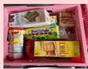
交野市倉治図書館 6.11