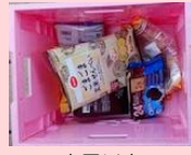
寝屋川市 産業振興センター 6.16