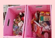
中部環境事業センター (天王寺区役所) 6.20