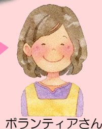
ボランティアさん

こども食堂が子どもたちの居場所であるように、和気あいあいと楽しく動けるボランティア活動は、私にとっても私の居場所となっています♥